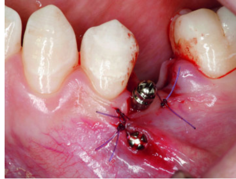
Zwei Mini-Schraubenimplantate vestibulär distal Regio 34 zur kortikalen Verankerung bei geplanter Mesialisierung der Molaren unmittelbar postoperativ. Beitrag F. P. Strietzel, H. Wehrbein: Seite 50