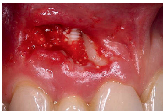
Abbildung 2 Knochendefekt nach Membran- und Augmentatentfernung mit freiliegendem Implantat regio 12 und freiliegender Wurzel Zahn 11

Figure 1 Dehiscent wound area 3 weeks after implant insertion and 1 week after buccal reaugmentation (performed elsewhere)