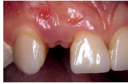
Abbildung 6 Das chirurgische Ergebnis nach der Einheilung des Bindegewebe-Transplantats

Figure 5 Connective tissue graft for defect closure in situ