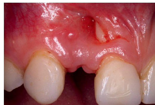
Abbildung 3 Sekundäre Wundheilung nach Implantatentfernung mit partiell freiliegender Wurzel Zahn 11

Figure 2 Bone defect after membrane and augmentation removal, showing the exposed implant in region 12 and exposed root of tooth 11