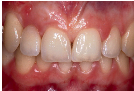
Abbildung 8 Einflügelige Adhäsivbrücke, befestigt an Zahn 13, zum Lückenschluss, 2-Jahres-Recall.

Figure 7 Clinical situation after 3 months. The remaining bone loss at tooth 11 made it impossible to place another implant. A resin bonded bridge was the best option for closing the gap.