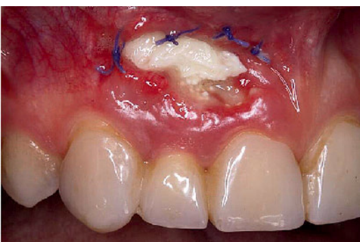
Abbildung 1 Dehiszentes Wundgebiet 3 Wochen nach Implantatsetzung und eine Woche nach bukkaler Nachaugmentation (alio loco durchgeführt)

heftung und definiert damit die rot-weiße Ästhetik. Narben aufgrund ungünstiger Inzisionen müssen vermieden werden; sie sind Merkmale einer schlechten Wundheilung und ergeben ein schwer mobilisierbares Gewebe. War bis vor wenigen Jahren ein Knochendefizit noch eine absolute Kontraindikation für eine Implantatinserktion [27], so konnte durch die gesteuerte Knochenregeneration (GBR) das Spektrum der Implantologie deutlich erweitert werden [7]. Nach Zahnverlust wurde bisher die verzögerte Sofortimplantation bevorzugt, um eine teilweise Weichgewebe- und Knochenheilung zu erreichen [14]. Dabei wurde je nach Größe und Morphologie des Knochendefekts ein einzeitiges oder zweizeitiges, augmentatives und implantologisches Vorgehen durchgeführt [9]. Wurde bei zweizeitig zur Implantation durchgeführten Augmentationen anfänglich mit Zeltpfosten-Konstruktionen zum Volumenerhalt und mit Membrantechniken gearbeitet [6], so wurde schnell erkannt, dass mit Knochenersatzmaterial oder Knochen-implantaten bessere Ergebnisse hinsichtlich des Volumengewinns erzielt werden konnten [5].