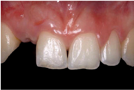
Abbildung 7 Klinische Situation nach 3 Monaten. Der zurückgebliebene Knochenverlust am Zahn 11 schloss eine erneute Implantation aus. Eine Adhäsivbrücke war die sinnvollste Lösung für den Lückenschluss.

Figure 7 Clinical situation after 3 months. The remaining bone loss at tooth 11 made it impossible to place another implant. A resin bonded bridge was the best option for closing the gap.