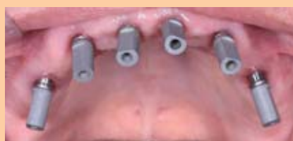
Abb. 6: Für den Intraoralscan wurden alle Implantate mit Scanbodies versehen.

Abb. 1–4, 6: Aleksandrov G./ Abb. 5: ChampionsImplants