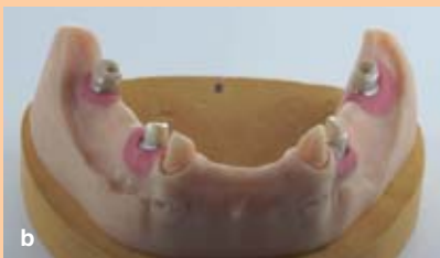
Abb. 8a/b: Die Zirkoniumdioxid-Primärkronen auf dem Modell: Sie wurden aus einer Zirkon-Ronde gefräst und auf Titanbasen einzementiert.