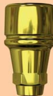
Abb. 5: Die verwendeten Shuttles erlaubten in ihrer Doppelfunktion (chirurgische Verschlusschraube und Gingivaformer) den Verzicht auf eine traumatische Freilegung.